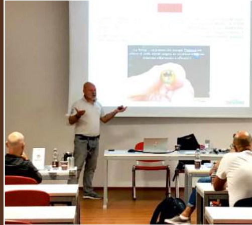
Training in de klas van Costadoro Academy