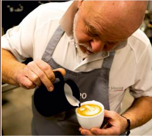
Oefenen in het lab van de Costadoro Academie

Costadoro hecht het grootste belang aan het opleiden van professionals en het verspreiden van de Koffie cultuur door het organiseren van één op één lessen, speciale evenementen en praktijkproeven. De toegewijde cursussen bieden verschillende trainingsniveaus, waarbij alle onderwerpen en disciplines aan bod komen: basis koffiezetten, koffie sensorische evaluatie, koffiezetten, latte art, marketing en management. Het is ook mogelijk om IAC- en SCA-examens af te leggen voor erkende kwalificaties zoals het koffieproeversbrevet of de internationale certificeringen van het Coffee Diploma System.