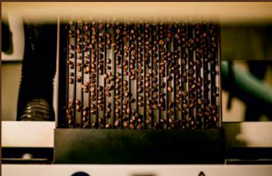
De innovatieve SORTEX Z + 1BL machine.